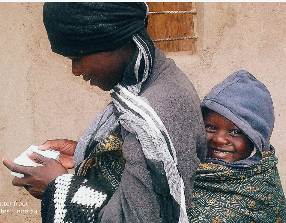
Eine junge Mutter freut sich, über Gottes Liebe zu lesen.

bald hatten wir kaum noch Literatur. Wir mussten ganzen Familien und vielen Kindern sagen, dass wir nicht genug Schriften für alle hatten, und dass sie sie teilen mussten. Das war sehr schwierig für uns.