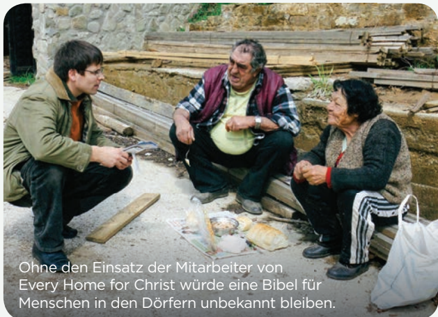
Ohne den Einsatz der Mitarbeiter von Every Home for Christ würde eine Bibel für Menschen in den Dörfern unbekannt bleiben.

Ihre Herzen waren besonders bewegt, als sie mit einer Bauersfrau redeten. Auf die Frage, ob sie eine Bibel habe, antwortete sie: «Ich habe mein ganzes Leben lang davon geträumt, eine Bibel zu besitzen. Ich habe sogar lange Zeit immer wieder etwas Geld auf die Seite gelegt, um eines Tages genug zu haben, um eine Bibel zu kaufen». Als es endlich soweit war, gingen die Frau und ihr Mann in einen Buchladen, um ihre langersehnte Bibel zu kaufen. Ihr Mann entschied jedoch, das Geld für ein säkulares Buch auszugeben, und die Frau weinte bitterlich. Ihr Herz war gebrochen.