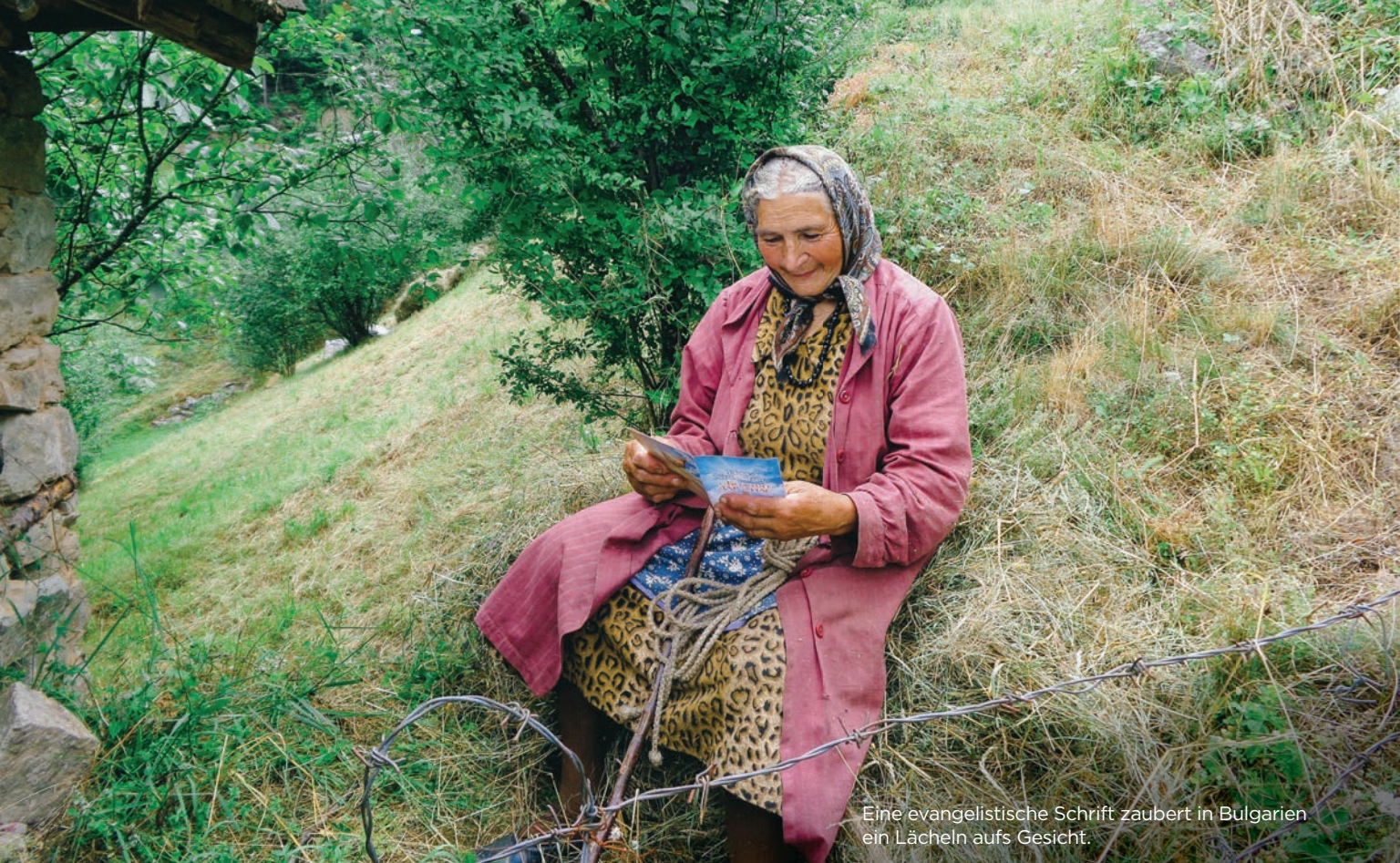
Eine evangelistische Schrift zaubert in Bulgarien ein Lächeln aufs Gesicht.